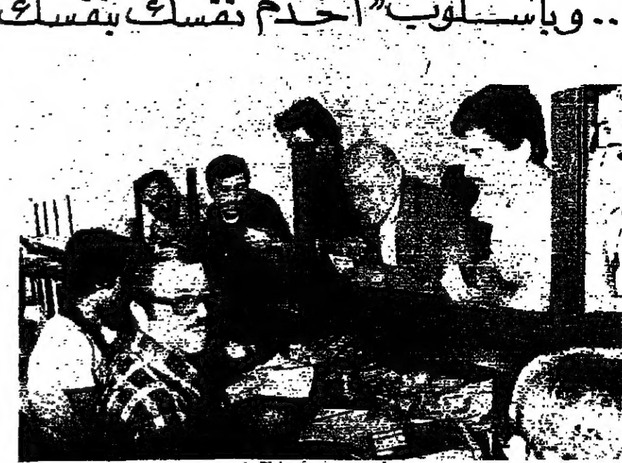
ابن الصنوق... الموظف الوحيد يعاونه احد المتدربين